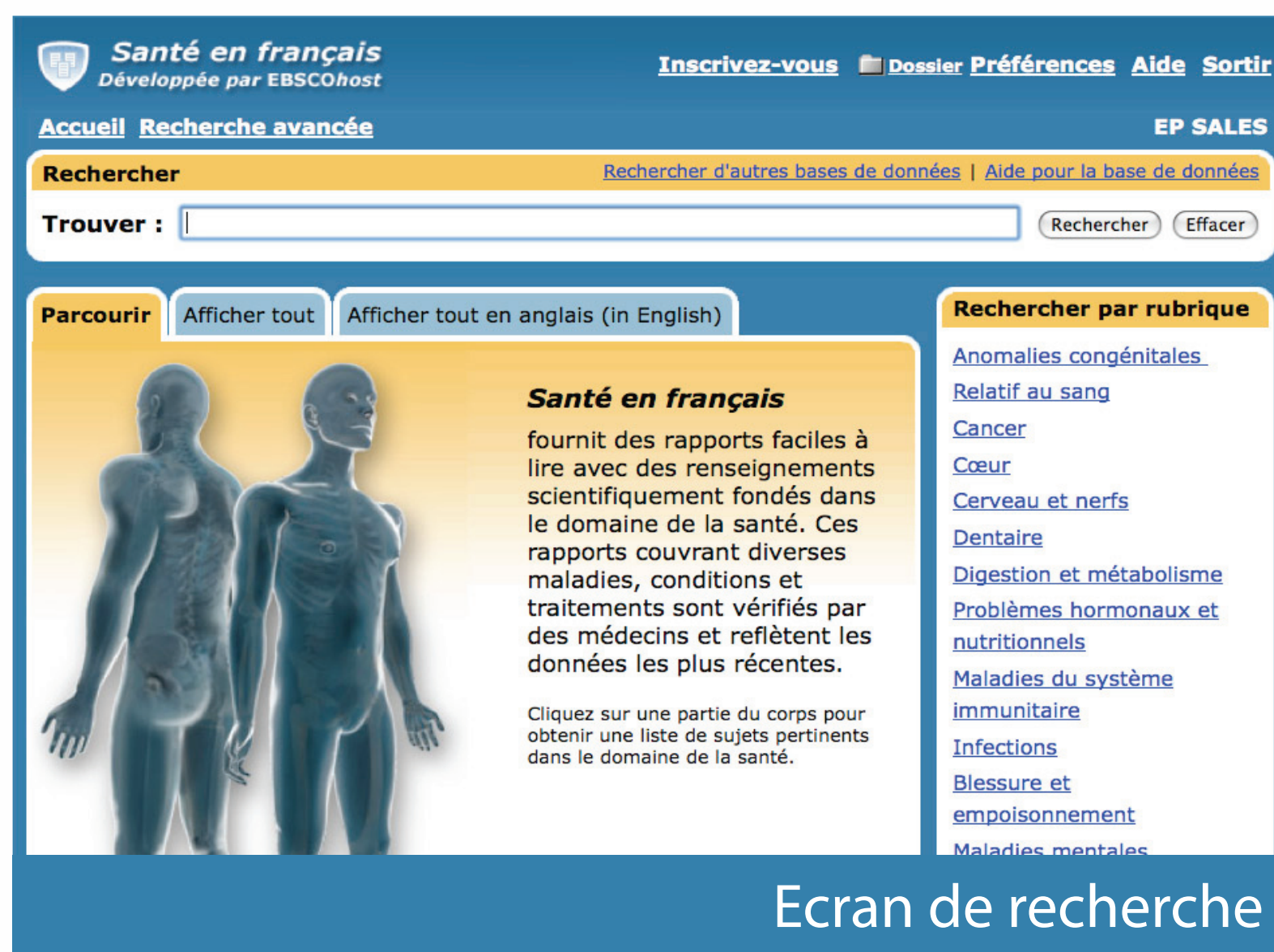
Ecran de recherche