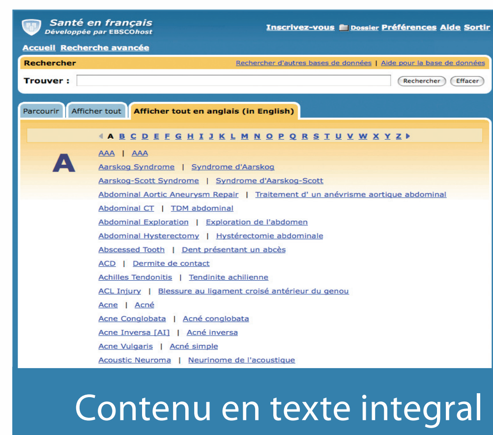
Contenu en texte intégral